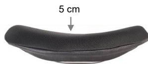
Contorno Standard (SC)