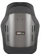
Altura Ombros Altura: 53 cm

Disponíveis suportes laterais, apoios de cabeça e arnés