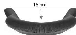
Contorno Profundo Pélvico (PDC)