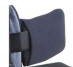
Suporte lateral fixo