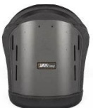
Torácico Superior Altura: 46 cm