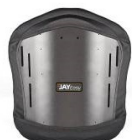
Torácico Médio Altura: 38 cm