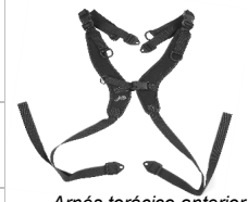
Arnés torácico anterior